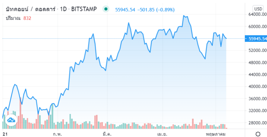
กราฟราคา Bitcoin ตั้งแต่ต้นปี 2021

ในปี 2021 นับเป็นปีที่ตลาดสกุลเงินดิจิทัล หรือ Cryptocurrency ได้รับความสนใจอย่างมาก นักลงทุนทั่วโลกต่างหันมาเข้าลงทุนในตลาด Cryptocurrency กันอย่างต่อเนื่อง จนทำให้ในช่วงเดือนเม.ย.ที่ผ่านมาราคาของ Bitcoin ปรับตัวขึ้นสูงสุดแตะระดับ 64,000 ดอลลาร์สหรัฐฯ หรือราว 2 ล้านบาท โดยปรับตัวเพิ่มขึ้นราว 120% นับตั้งแต่ต้นปี